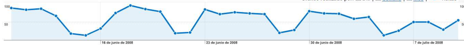
Gráfico realizado por: Dia Semana Mes Visitas