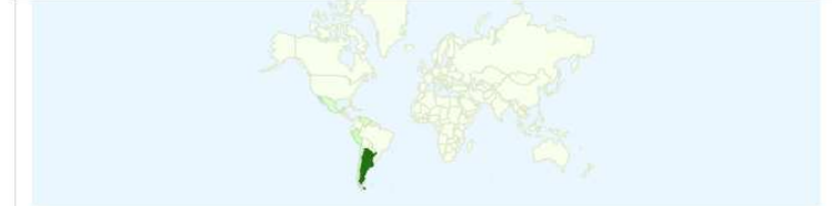
Gráfico de visitas por ubicación